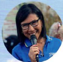
di Dora Arena