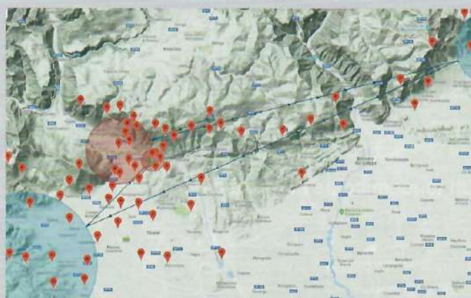
CLASSE SERIAL: 79,5 Km. Il percorso, identico per la gran parte alla classe sport, si è differenziato per l'allungamento della boa della Val Rovina sino al Monte Grappa (wp esterno). Ciò ha comportato, ripetto alla classe Sport, il problema dell'attraversamento nei due sensi della Val-sugana, comunque premiato all'andata da condizioni generose a Basano, che hanno permesso di fare buona quota anche per il ritorno.