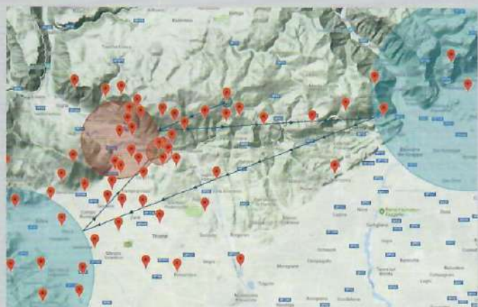
CLASSE SPORT: 54,6 Km. Due le difficoltà maggiori in questo tracciato che ha visto termiche generose intervallate da qualche "buco" a sorpresa dell'attività termica: l'attraversamento della famosa Val di Laverda, sino in Val Rovina (a est di Rubbio) che si è dovuto eseguire sia all'andata che al ritorno; la grande boa esterna a sud ovest del Monte Summano che lambiva la città di Schio, con un ritorno alla Rivit inedito per le condizioni aerologiche.