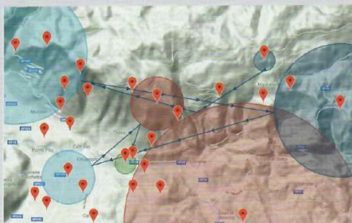
CLASSE FUN: 25,3 Km. La task si è sviluppata nell'area del costone di Caltrano dove i piloti si sono cimentati in un'anda e rianda non banale in quanto a possibili scelte. Una boa "esterna" ha dato la possibilità ai novizi di cimentarsi anche dovendo lasciare il costone.